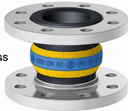
Type ERV-GS HNBR

YELLOW STEEL HNBR expansion joints for petroleum based products, DIN EN fuels up to 50% aromatic content, cooling water with oily anticorrosion additives, lubrication and hydraulic oil, seawater. Very good aging, weathering and ozone resistance. Temperature (depending on medium) range -35 °C up to +100 °C, temporarily up to +120 °C. Fire resistant to ISO 15540 up to 30 min. at 800 °C. Electrically dissipative.