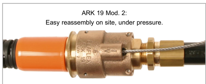
ARK 19 Mod. 2: Easy reassembly on site, under pressure.