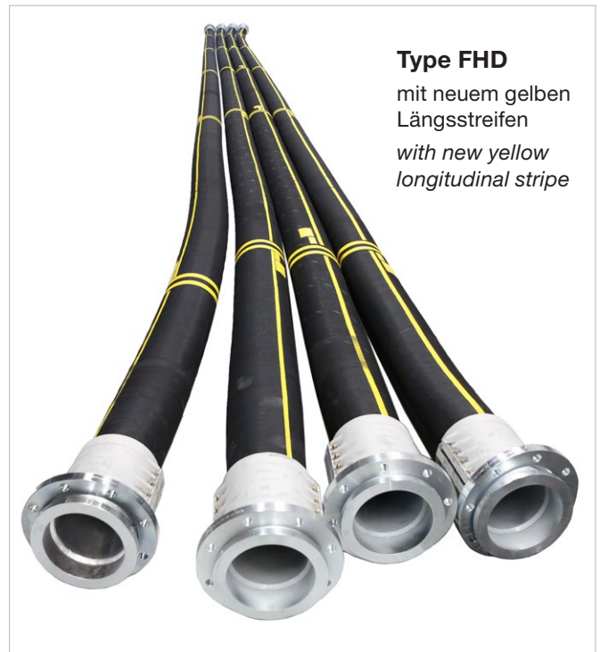
Type FHD mit neuem gelben Längsstreifen with new yellow longitudinal stripe

Spannloc safety clamps made of aluminum are generally used for marine applications in salty environment. Note: For this purpose, Spannloc clamps will be delivered with nuts and screws made of stainless steel – at no extra charge. As an alternative Spannloc made of stainless steel can be provided for highest corrosion-resistance. New available: Size DN 150.