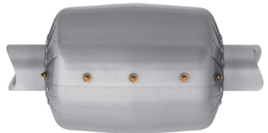
Gesloten / fermé